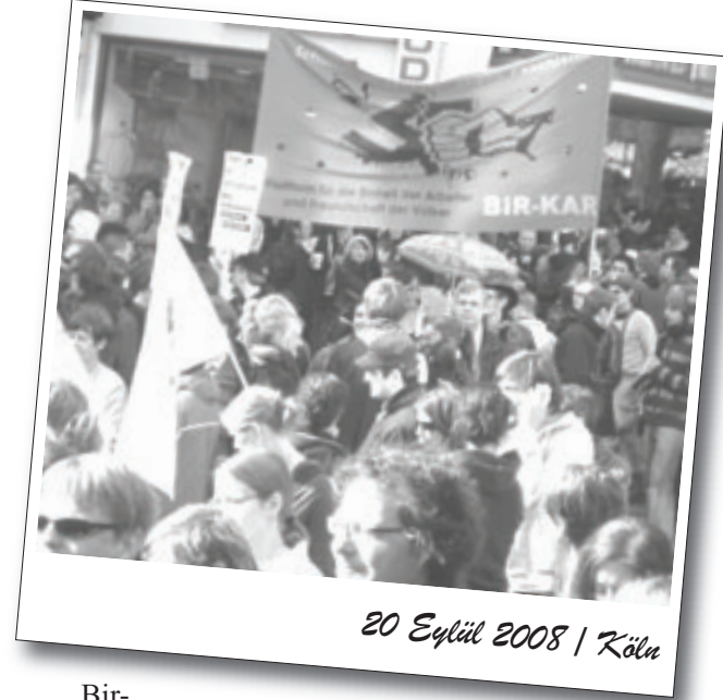
20 Eylül 2008 / Köln

Eylemde sık sık "Naziler dışarı!", "Doğu'da, Batı'da, kahrolsun Nazi vebası!", "Yaşasın uluslararası dayanışma!", "Faşizme her yerde ölüm!", "Dayanışma direniş demektir, her ülkede faşizme karşı savaş!" sloganları sık ve gür bir şekilde atıldı.