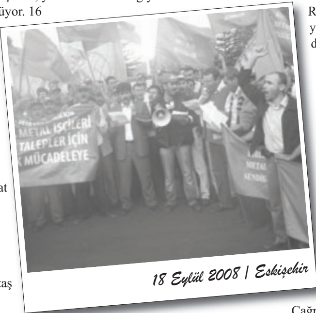
18 Eylül 2008 | Eskişehir

"Evet, tarih olarak Türk Metal MESS'ten önce kurulmuştur ancak, Türk Metal 1983 yılında MESS'in üyelerine vermiş olduğu talimatla, 1980 öncesi DİSK'e bağlı Maden İş sendikasının örgütlü olduğu işyerlerine sokulmuş ve Maden İş'in üyeleri bir gün içinde Türk Metal'e üye yapılmıştır. Bu üyelikler için