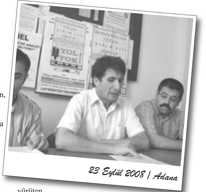
23 Eylül 2008 | Adana

17 Eylül akşamı Harbiye'de Lütfi Kırdar Kongre ve Sergi Sarayı yakınındaki plazalar önünde eylem yapan çağrı merkezi çalışanları, kendileri gibi esnek ve güvencesiz çalışma koşullarına karşı mücadele